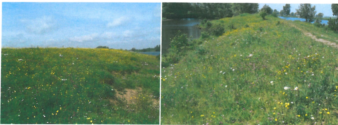
Foto's van een glanshaverhoiland

Uitspoelingsgaten/-sleuven dienen direct na de hoogwaterperiode te worden gedicht en te worden ingezaaid.