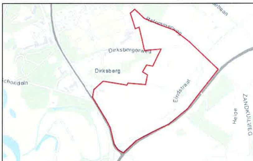
Figuur 1.2 Ligging plangebied (rode omlijning) ten zuiden van Roermond.

Op basis van literatuur-, sporen- en cameraonderzoek is onderzocht welke functie het plangebied (zie figuur 1.2) en de omgeving voor de das vervult anno 2013. Daarbij is een onderscheid gemaakt tussen verblijfplaatsen, foerageergebieden en verbindingroutes. Aan de hand van dit onderzoek is een inschatting gemaakt welke effecten de voorgenomen ontwikkelingen kunnen hebben op de das.