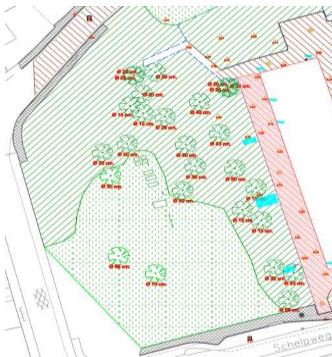
Figuur 7 | Huidige situatie gemeentelijk park

Bij de opwaardering van het park wordt gestreefd naar verwijdering van ongewenste wildgroei. Uitgangspunt is een plantsoen met gras, omzoomd door bossages en, vooral centraal, een beperkt aantal forse bomen. Bij de herinrichting wordt gestreefd naar open groen, nieuwe doorzichten en loopp lijnen (randvoorwaarde 24). Aanplant van een aantal nieuwe – liefst wat forsere – bomen kan een positieve bijdrage leveren aan de kwaliteit van dit plantsoen. Ten aanzien van de relatie tussen het gebouw, de aanwezige functies in het gebouw en het park is gekozen voor een optimale open structuur. Dit komt het gebouw en het park en de onderlinge relatie ten goede. De aan het gebouw grenzende bomen kunnen worden verwijderd.