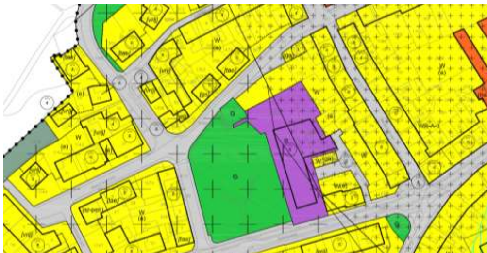
Figuur 6 | uitsnede vigerend bestemmingsplan Kom Domburg

In het bestemmingsplan is een groot deel van het plangebied aangeduid als Bedrijf (B). Voor deze bestemming gelden, voor zover relevant, de volgende regels: