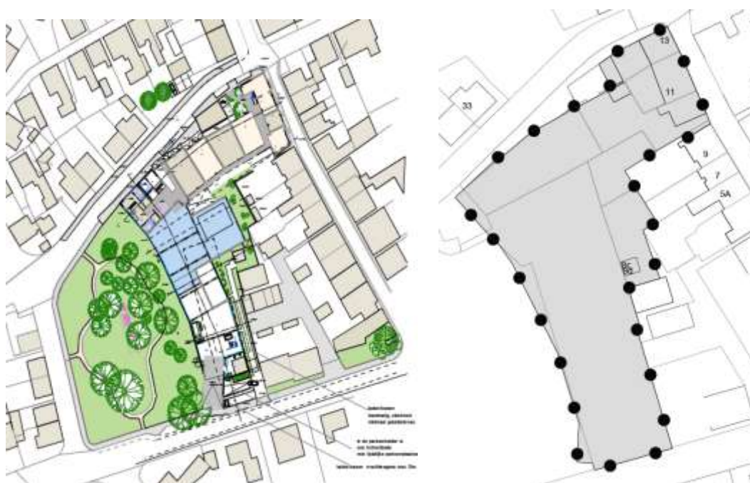
Figuur 4 | impressie van de ontwikkeling (begane grond) en IMRO gebiedskaart

B's Onroerend Goed BV is voornemens een vitaliteitshotel te realiseren op de planlocatie. Hierbij wordt uitgegaan van de realisatie van 33 hotelsuites van ongeveer 100 m 2 en 6 minisuites van ongeveer 35-65 m 2 . Een deel van de suites, die te karakteriseren zijn als luxe hotelkamers zonder dat sprake is van een zelfstandig verblijfsobject, zal worden gesplitst in twee of drie hotelkamers of minisuites. Bij de aanvraag omgevingsvergunning fase 2, de omgevingsvergunning voor onder meer de activiteiten bouwen, brandveilig gebruik, milieumelding etc. zal dit worden aangegeven. De hotelsuites zijn gelegen op de begane grond aan de zijde van de Beatrixstraat en (de noordzijde van) de Weverijstraat en op de eerste en tweede verdieping van het gehele gebouw. De hotelsuites kennen een hoge kwaliteit en worden in eigen beheer geëxploiteerd en/of verkocht. Hiermee is ruim 5.200 m 2 bvo (excl. parkeren) van het gebouw gemoeid. De entree/horeca/wellness omvat 1.140 m 2 , nader onder te verdelen.