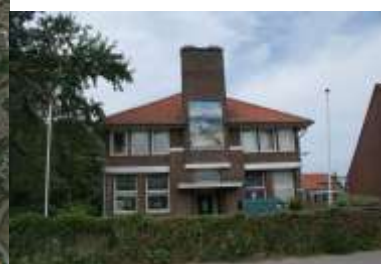
Figuur 2 | voormalige KPN centrale