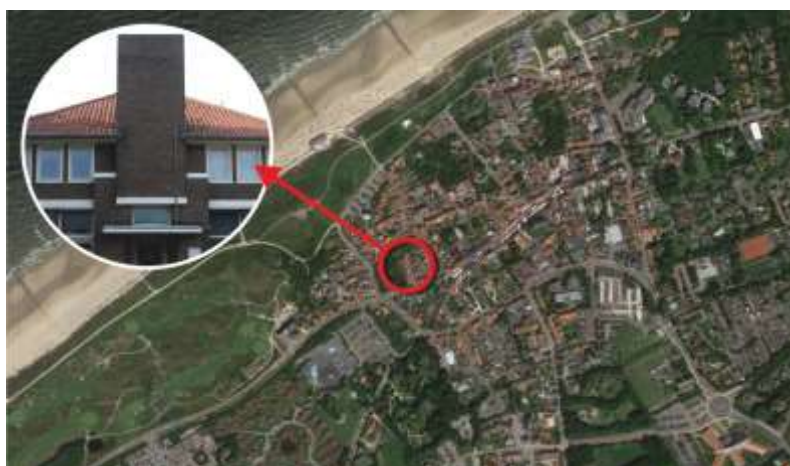
Figuur 1 | ligging plangebied in Domburg

De ontwikkellocatie in Domburg wordt omsloten door de Beatrixstraat, Weverijstraat, Schelpweg en de Van Voorthuysenstraat. Het betreft het perceel van een voormalige KPN telefooncentrale, aangevuld met percelen aan de Beatrixstraat en de Weverijstraat.