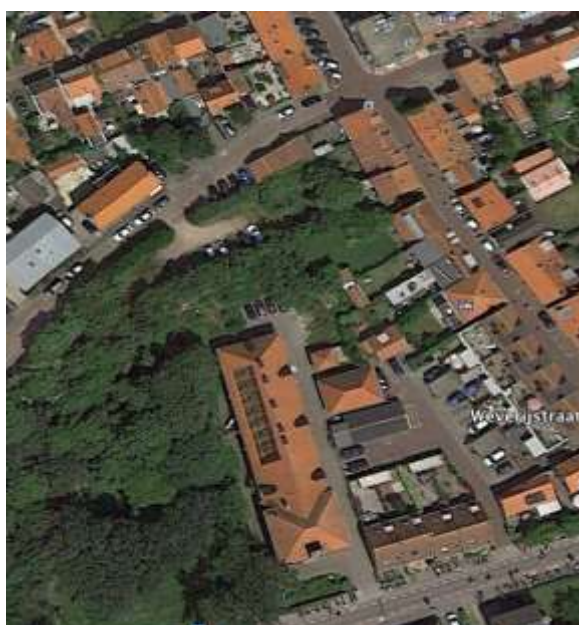
Figuur 3 | plangebied nu