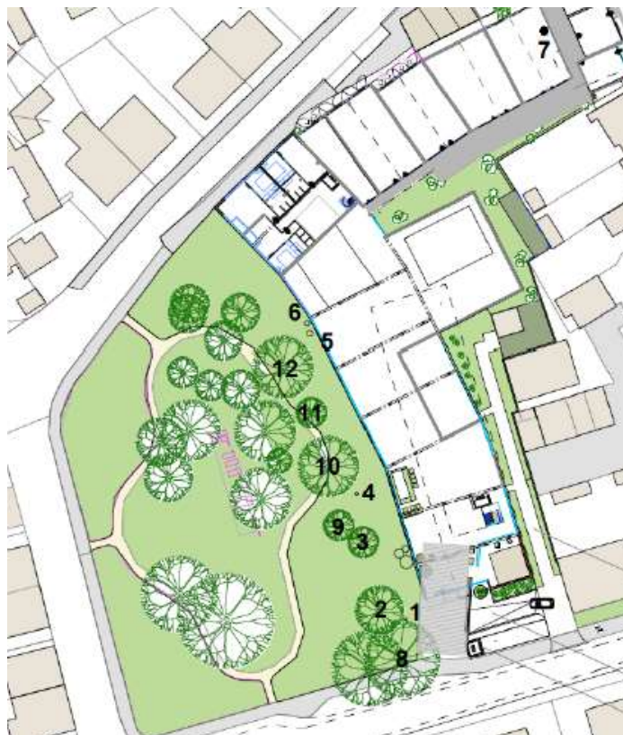
Figuur 8 | De bomen in het park