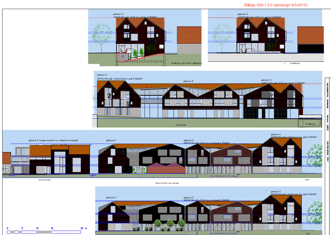
Figuur 5 | Impressie gevelaanzichten

Het plan wordt gerealiseerd op de percelen met de volgende kadastrale nummers (bijlage 2): Gemeente Veere, kaart Domburg sectie F nummer 36 (ged.), 45 (ged.), 49 (ged.), 515, 1749, 1750, 1751, 1754 (ged.), 2323 en 2324.