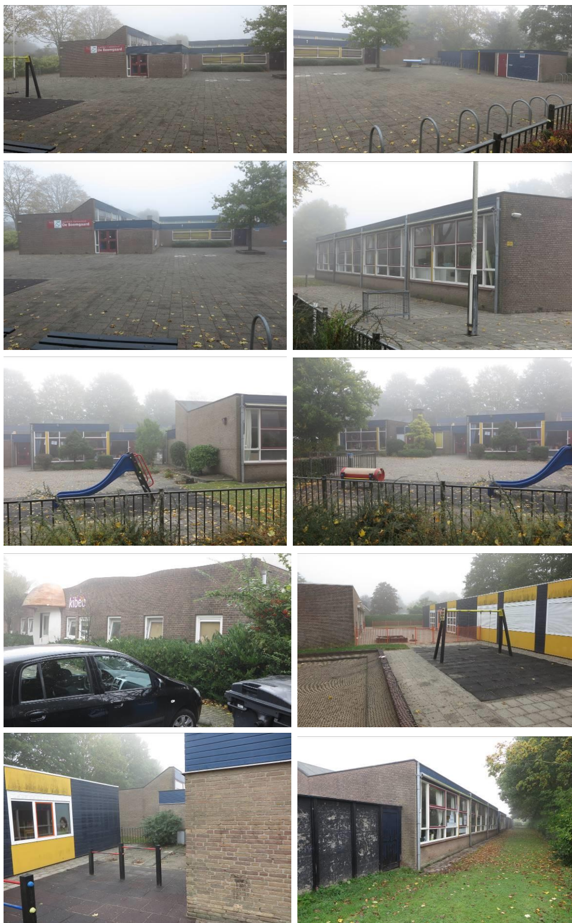
Figuur 2. Aanzicht van het plangebied De Boomgaard te Mijnsheerenland op vrijdag 21 oktober 2016.