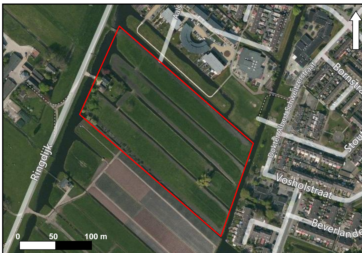
Figuur 1. Het plangebied (rood omlijnd) op een luchtfoto uit 2010

Het plangebied ligt ten westen van de dr. A. Schweitzerstraat en ten oosten van de Ringdijk. IN het noorden wordt het plangebied begrensd door de bebouwing aan de Aalsgolverlaan (Figuur 1). Het te verstoren gedeelte van het terrein is 2,6 ha groot en is ten tijde van het onderzoek in gebruik als weilanden.