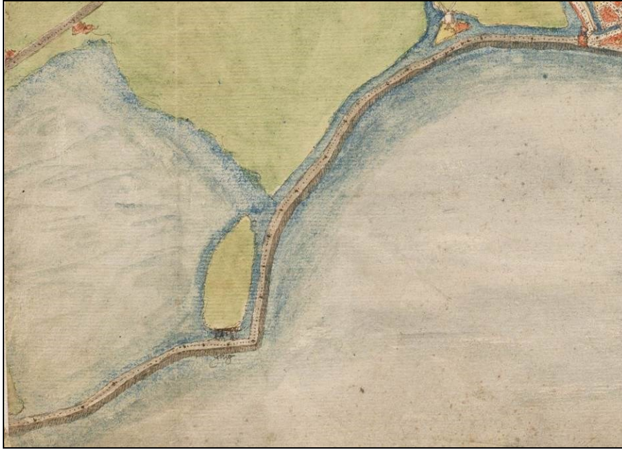
Afb. 3 De Grote Waal is op de kaart van Van Deventer uit ca. 1560 een groot meer binnen de dijk (op de afbeelding links).

In 1627 werd de Grote Waal ingepolderd. Een ringdijk met ringwater werd aangelegd en poldermolens werden gebouwd (afb. 4). De nieuwe polder werd in twee ongeveer gelijke delen verdeeld door een weg: de Middelweg. Bij de bouw van de nieuwbouwwijk de Grote Waal is deze structuur gehandhaafd door aanleg van een ontsluitingsweg (de Middelweg). Ook een gedeelte van het ringwater is gehandhaafd waardoor de oorspronkelijke vorm van de Grote Waal nog goed is te herkennen.