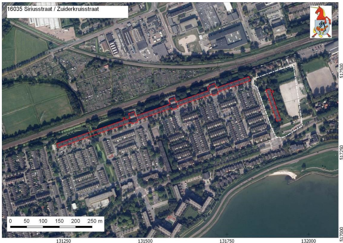
Afbeelding 1. Ligging bouwblokken (rode stippellijn) en de Prisma-locatie (witte stippellijn) op googlemaps.

Op de beleidskaart archeologie van de gemeente Hoorn staan enkele locaties aangegeven waar op basis van historisch kaartmateriaal archeologische resten aanwezig zullen zijn (afb. 2). Deze locaties hebben een vrijstellingsgrens van 100 m 2 gekregen. Voor het overige deel van het plangebied geldt een lage archeologische verwachting voor alle perioden; op de beleidskaart is dit vertaald naar een vrijstellingsgrens voor archeologisch onderzoek van 10.000 m 2 . Ten oosten van de dijk om De Grote Waal is het plangebied in zijn geheel vrijgesteld van archeologisch onderzoek.