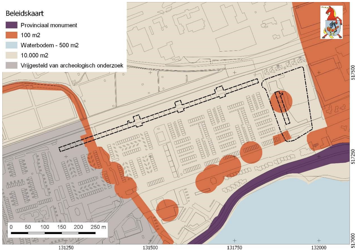
Afbeelding 2. Plangebied Siriusstraat-Zuiderkruisstraat op de beleidskaart archeologie.