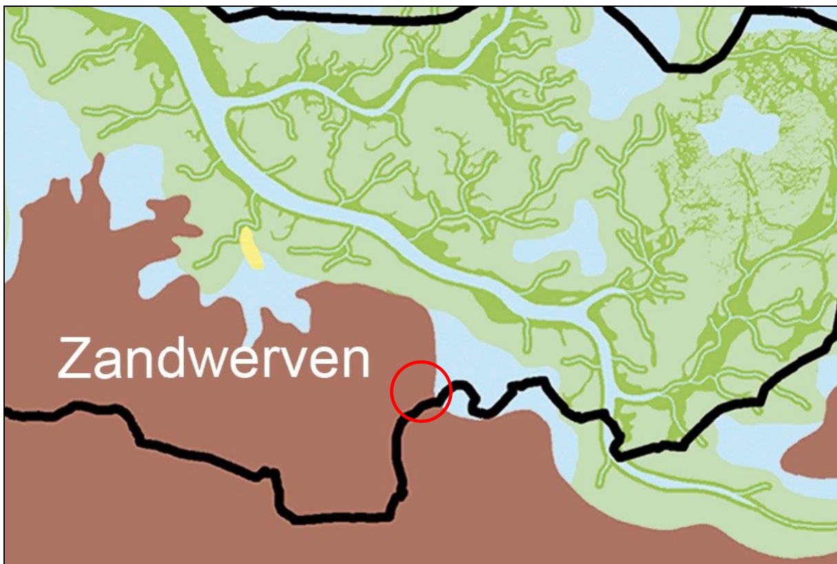
Afbeelding 6 . Globale ligging plangebied (rode cirkel) op de paleogeografische kaart rond 2250 voor Chr. De Westfriese Omringdijk is als dikke zwarte lijn aangegeven. Bruin is met veen begroeid, lichtblauw brak en zoutwater, lichtgroen de wadden en slikken en middengroen de kreekeovers en kwelders. In geel staat de strandwal van Zandwerven aangegeven.

In de directe omgeving van het plangebied zijn enkele locaties bekend waar vooral aardewerk uit de 17 de eeuw is aangetroffen (vondstmelding 1026, 1067, 1093, 1117 en 1187). Bij de bouw van de Grote Waal is destijds geen archeologisch onderzoek uitgevoerd. In het plangebied is nog geen vondstmateriaal aangetroffen. Zoals in de inleiding aangegeven is het plangebied opgespoten met zand uit het IJsselmeer. Resten van huisplaatsen, molens en molengangen en de resten van de dijk om de Grote Waal zijn vermoedelijk nog aanwezig in de ondergrond. Archeologische resten voorafgaande aan de Middeleeuwen worden niet verwacht, vanwege de geologische ondergrond (afb.5). Hierdoor geldt voor het gehele plangebied een lage archeologische verwachting voor vindplaatsen vanaf het Laat-Neolithicum tot de Middeleeuwen. Voor huisplaatsen uit de Middeleeuwen geldt eveneens een lage archeologische verwachting.